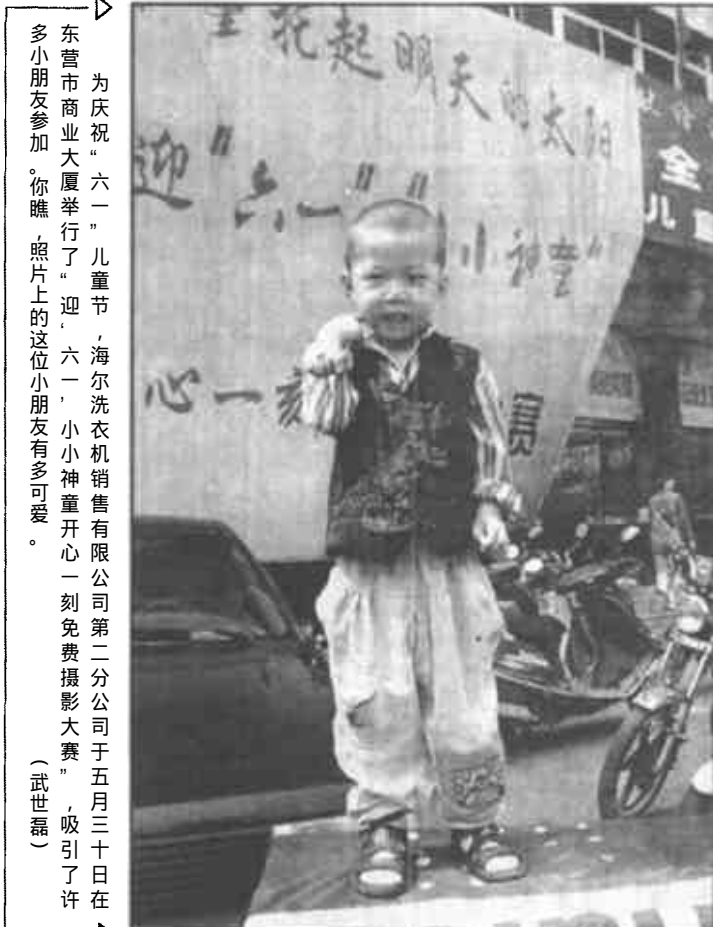
为庆祝“六一”儿童节，海尔洗衣机销售有限公司第二分公司于五月三十日在东营市商业大厦举行了“迎六一”小小神童开心一刻免费摄影大赛，吸引了许多小朋友参加。你瞧，照片上的这位小朋友有多可爱。(武世磊)

付出必有回报，垦利县农行在积极促进个体私营经济蓬勃发展的同时，自身各项业务也不断得到长足发展。(张树红)